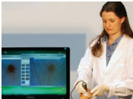
Dino-Lite DermaScope w użyciu

Są negatywne i pozytywne strony tej sytuacji. Jeżeli rezultat jest pozytywny, mogą uspokoić natychmiast pacjentów , rozmawiając z nimi przez telefon, ale jeżeli jest coś podejrzanego, pacjent odwiędzi dermatologa następnego dnia zamiast czekać w zawieszeniu przez kilka tygodni. Czyli niezależnie, jaka jest sytuacja jest to lepsze dla pacjenta.”